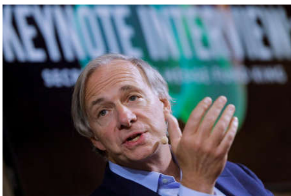
เรย์ ดาลิโอ (Ray Dalio)

รายงานฉบับนี้จัดทำขึ้นโดยข้อมูลเท่าที่ปรากฏและเชื่อว่าเป็นที่น่าเชื่อถือได้แต่ไม่เป็นการยืนยันความถูกต้องและความสมบูรณ์ของข้อมูลนั้นๆ โดยบริษัทหลักทรัพย์ ยูโอบี เคย์ เฮียน (ประเทศไทย) จำกัด (มหาชน) ผู้จัดทำขอสงวนสิทธิ์ในการเปลี่ยนแปลงความเห็นหรือประมาณการณต่างที่ปรากฏในรายงานฉบับนี้ โดยไม่ต้องแจ้งล่วงหน้า รายงานฉบับนี้มีวัตถุประสงค์เพื่อใช้ประกอบการตัดสินใจของนักลงทุน โดยไม่ได้เป็นการชี้นำ ชักชวนให้นักลงทุนทำการซื้อหรือขายหลักทรัพย์ หรือตราสารทางการเงินใดๆ ที่ปรากฏในรายงาน